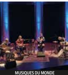
MUSIQUES DU MONDE

Réalisation CIMN - Détours de Babel / Co-réalisation AIDA- Arts en Isère Dauphiné Alpes. Avec le soutien du CIMN, du Département de l'Isère et de partenaires locaux