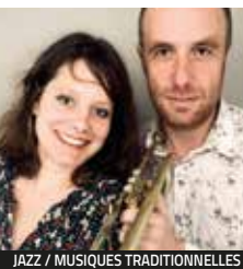
JAZZ / MUSIQUES TRADITIONNELLES

VEN. 24 MARS Mens SAM. 25 MARS Couvent des Carmes Beauvoir-en-Royans Tarif au choix (de 3 à 20€)