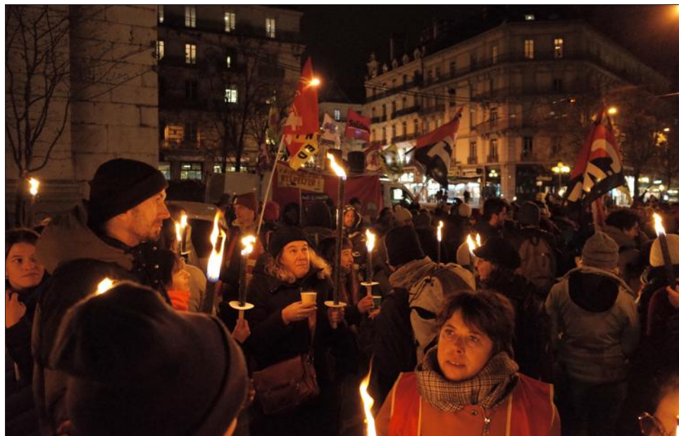
Flambeaux à la main, près de 300 personnes se sont rassemblées pour manifester contre la réforme des retraites à Grenoble, ce jeudi 25 janvier.