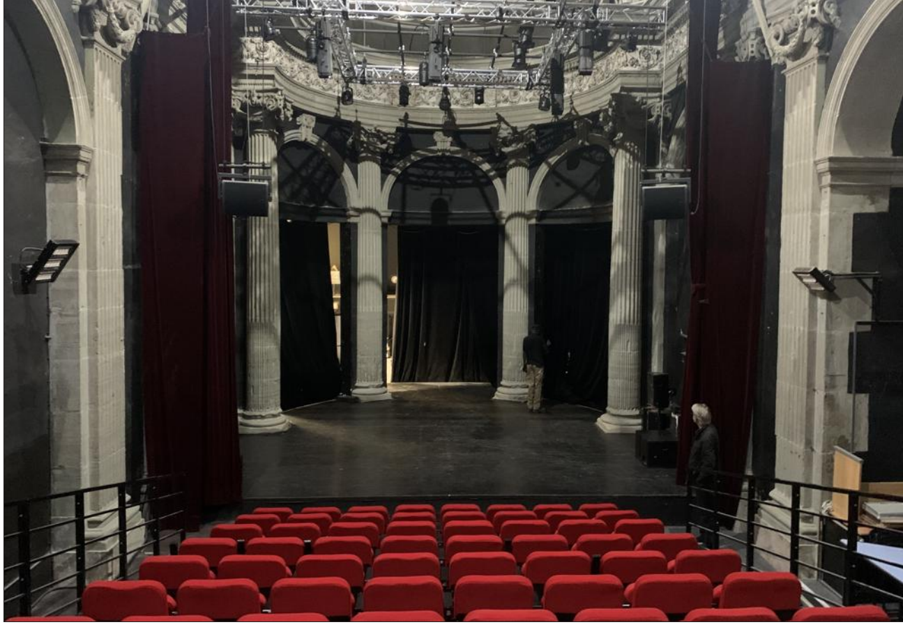
Le Théâtre Sainte-Marie-d'en-Bas est un joyau de Grenoble, situé dans le quartier Très-Cloîtres.