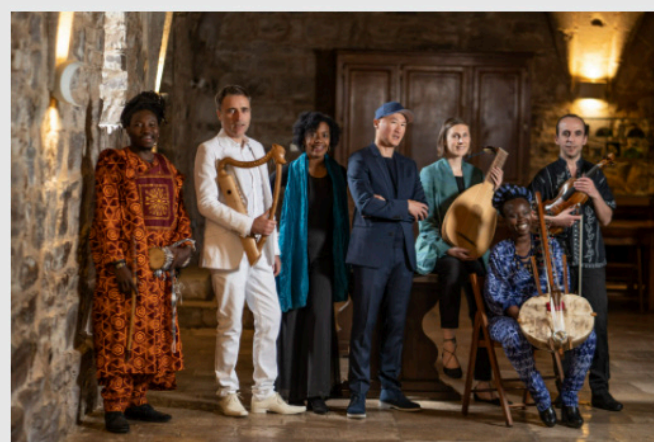
De la musique ancienne avec l'ensemble La Camera Delle Lacrime dans le cadre de la 12 e édition du festival Détours de Babel.

Les objectifs affichés de la salle municipale pour ce début d'année ? Proposer de la diversité, avec tous les styles musicaux, et respecter un équilibre des esthétiques musicales. La programmation se veut « accessible à tous et à portée pédagogique », mais aussi attentive à « l'égalité femmes-hommes sur scène », selon Ludivine Bosc. Notamment avec le festival Les femmes s'en mêlent qui aura lieu du 9 au 18 mars, dont La Source est partenaire. Une manière de « rendre visible la création et la scène féminine indépendante car les milieux du rock et du rap restent encore très masculins », regrette-t-elle.